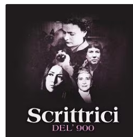
Scrittrici del '900